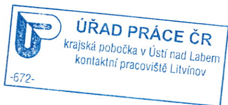
Jana Bednářová specialista dávek HN

Poučení: Pokud nesplníte povinnost, kterou Vám ustanovuje náš úřad na této výzvě, může Vám být podle § 49 odst. 5 zákona o pomoci v hmotné nouzi dávka nepřiznána.