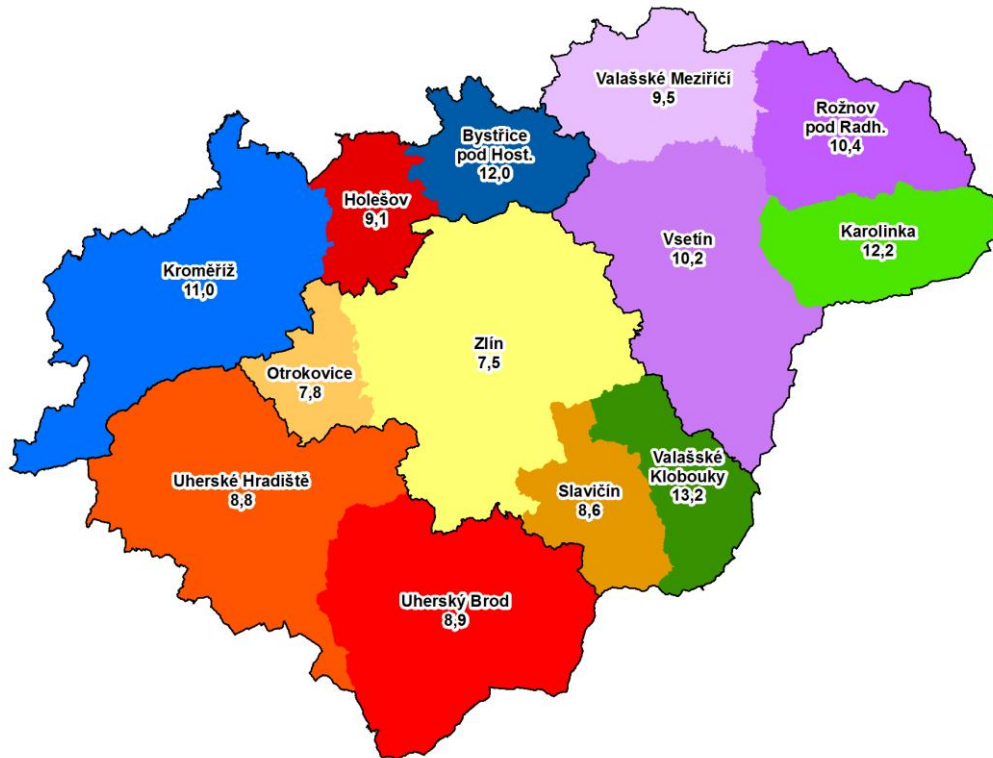
Uchazeči s nárokem na podporu v nezaměstnanosti k 30.4.2012