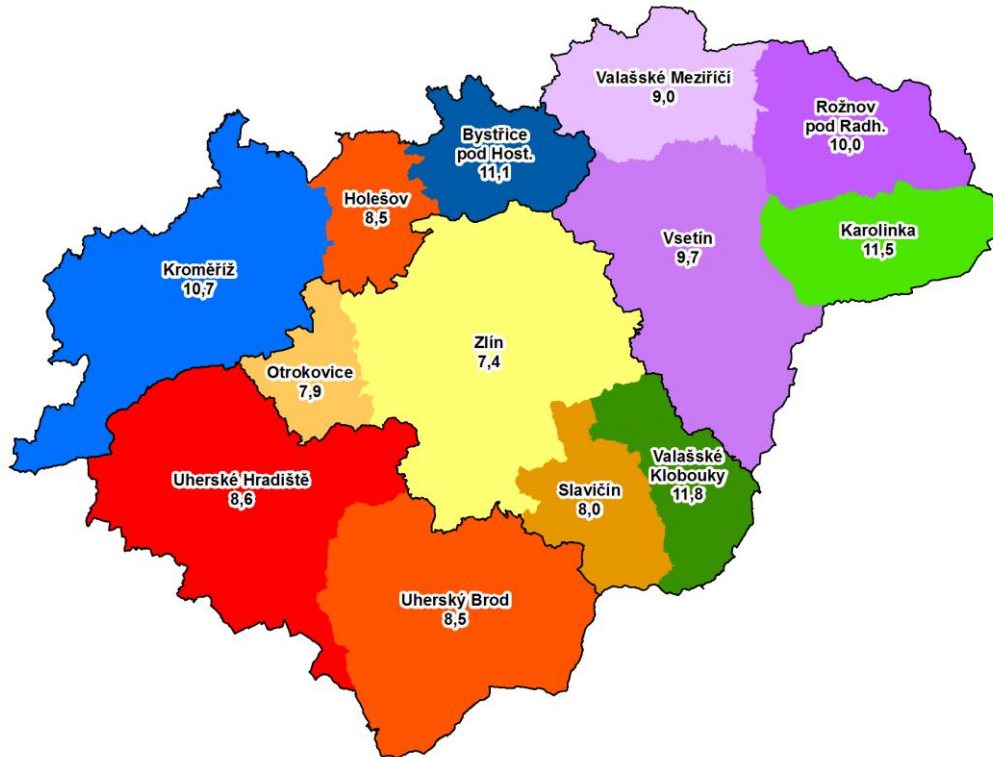
Počet uchazečů o zaměstnání na 1 VPM dle okresů v ČR k 31.5.2012