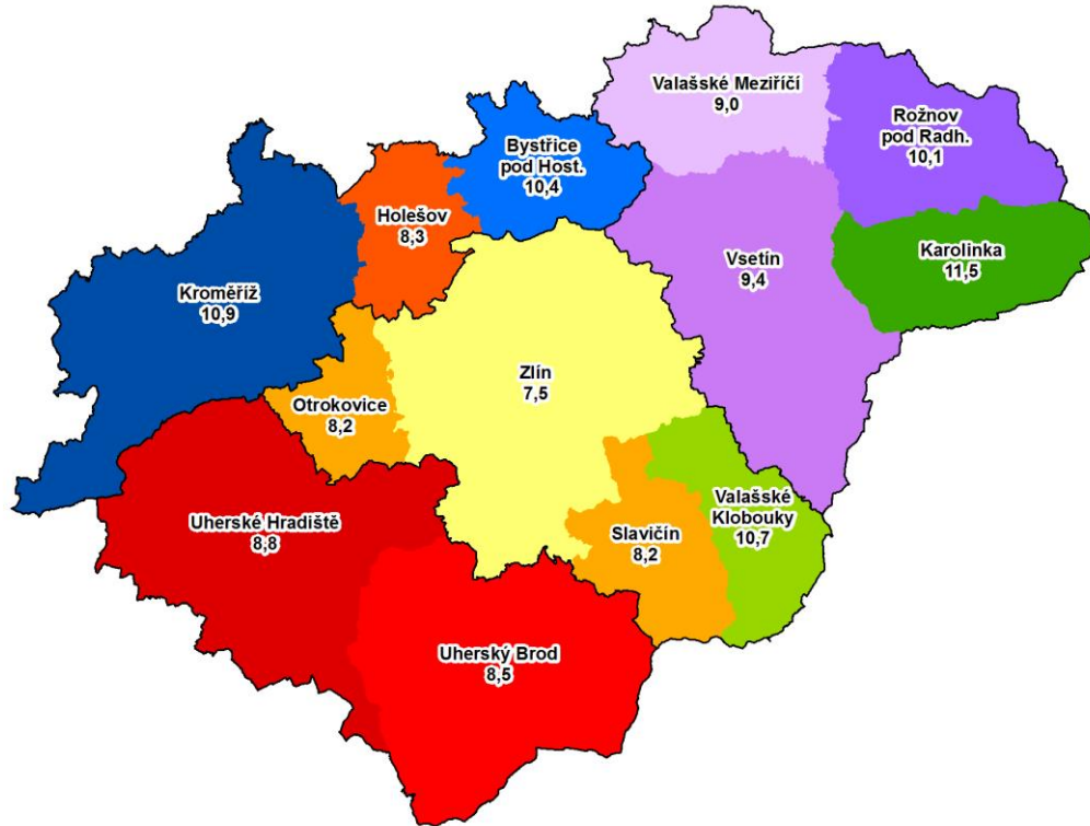
Aktivní politika zaměstnanosti - umístění uchazeči Zlínský kraj (od 1.1.2012 do 31.7.2012)